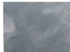
SILVER effetto nuvolato