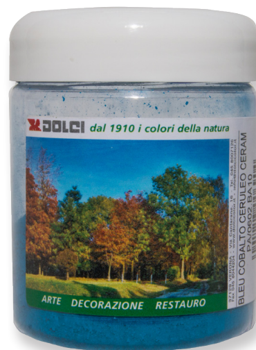
Bleu Cobalto Ceruleo ceramica barattoli da 100g

Le tinte riportate sono indicative e non hanno valore contrattuale. La ditta Dolci Colori Srl si riserva di apportare modifiche alla presente scheda senza alcun preavviso.