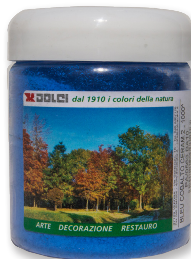
Bleu di Cobalto ceram 2 barattoli da 100g

Le tinte riportate sono indicative e non hanno valore contrattuale. La ditta Dolci Colori Srl si riserva di apportare modifiche alla presente scheda senza alcun preavviso.