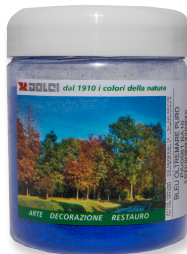
Bleu Oltremare Puro barattoli da 100g

Le tinte riportate sono indicative e non hanno valore contrattuale. La ditta Dolci Colori Srl si riserva di apportare modifiche alla presente scheda senza alcun preavviso.