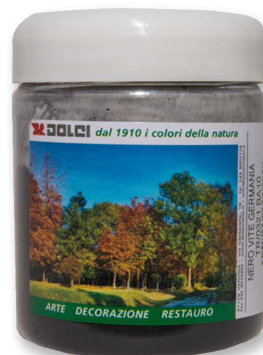
Terra Nero Vite Germania barattoli da 100g

Le tinte riportate sono indicative e non hanno valore contrattuale. La ditta Dolci Colori Srl si riserva di apportare modifiche alla presente scheda senza alcun preavviso.