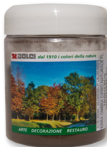
Terra Ombra Naturale Cipro FL, barattoli da 100g.

La ditta Dolci Colori Srl si riserva di apportare modifiche alla presente scheda senza alcun preavviso.