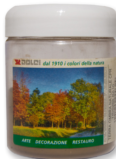
Terra Ombra naturale CPR barattoli da 100g

Le tinte riportate sono indicative e non hanno valore contrattuale. La ditta Dolci Colori Srl si riserva di apportare modifiche alla presente scheda senza alcun preavviso.