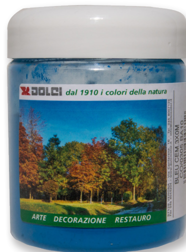
Bleu Cemento 3X0M barattoli da 100 g

Le tinte riportate sono indicative e non hanno valore contrattuale. La ditta Dolci Colori Srl si riserva di apportare modifiche alla presente scheda senza alcun preavviso.