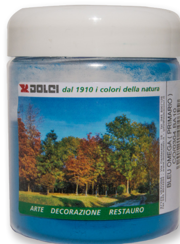
Bleu Omega Primario barattoli da 100 g

Le tinte riportate sono indicative e non hanno valore contrattuale. La ditta Dolci Colori Srl si riserva di apportare modifiche alla presente scheda senza alcun preavviso.