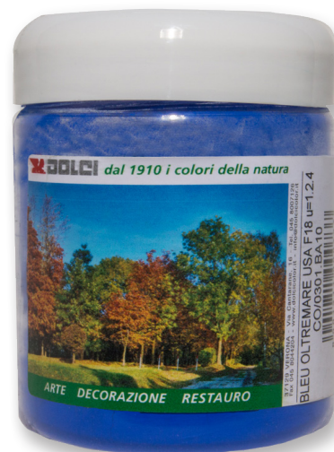
Bleu Oltremare USA F18 barattoli da 100 g

Le tinte riportate sono indicative e non hanno valore contrattuale. La ditta Dolci Colori Srl si riserva di apportare modifiche alla presente scheda senza alcun preavviso.