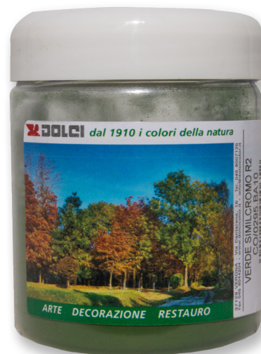
Verde Similcromo R2 barattoli da 100g

Le tinte riportate sono indicative e non hanno valore contrattuale. La ditta Dolci Colori Srl si riserva di apportare modifiche alla presente scheda senza alcun preavviso.