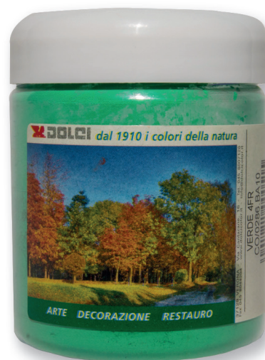
Verde 4 FR barattoli da 100g

Le tinte riportate sono indicative e non hanno valore contrattuale. La ditta Dolci Colori Srl si riserva di apportare modifiche alla presente scheda senza alcun preavviso.